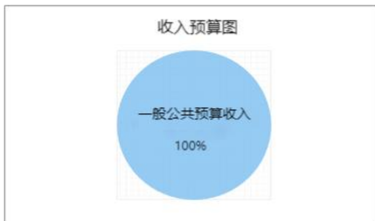
图 1. 收入预算图（可以饼图列示）